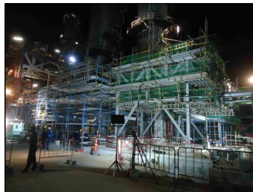
รูปที่ 2-18 ไฟส่องสว่างช่วงเวลากลางคืน