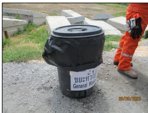
รูปที่ 2-6 ถังขยะมูลฝอยภายในพื้นที่โครงการ