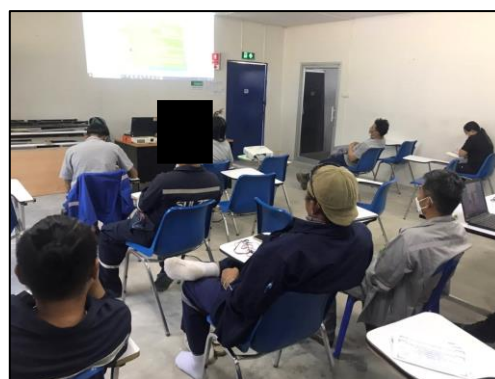
รูปที่ 2-15 กิจกรรมอบรมความปลอดภัยให้แก่คนงาน