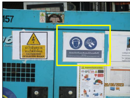
รูปที่ 2-4 ป้ายเตือนการสวมใส่อุปกรณ์ป้องกันเสียง