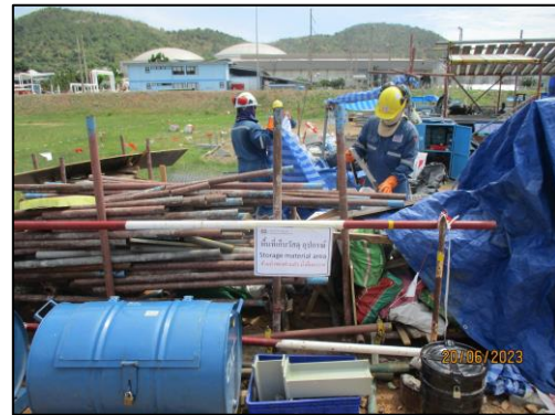
รูปที่ 2-16 พนักงานสวมใส่อุปกรณ์ป้องกันอันตรายส่วนบุคคลขณะปฏิบัติงาน