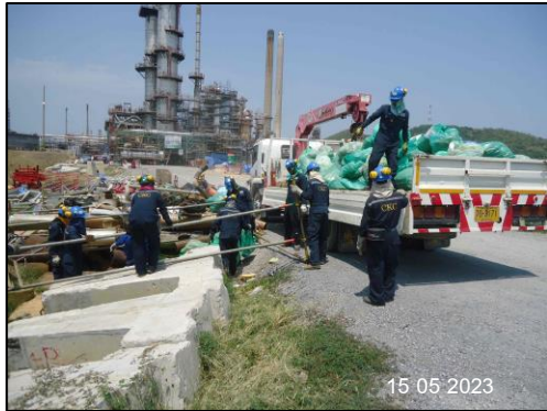
รูปที่ 2-7 เจ้าหน้าที่รวบรวมของเสียออกจากพื้นที่