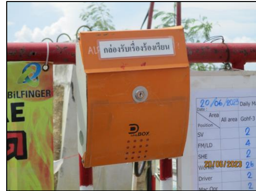
รูปที่ 2-8 กล่องรับเรื่องร้องเรียน