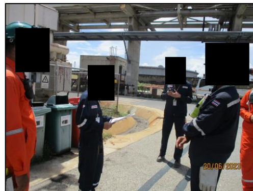
รูปที่ 2-21 เจ้าหน้าที่ความปลอดภัยประจำโครงการ