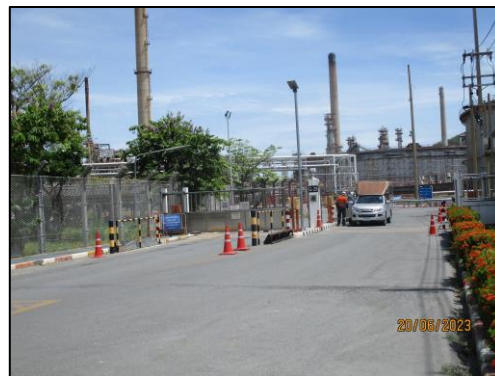
รูปที่ 2-14 บริเวณเข้า-ออกพื้นที่โครงการ