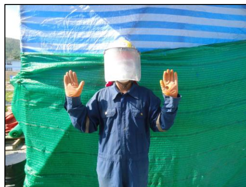
รูปที่ 2-2 อุปกรณ์ป้องกันฝุ่นละออง