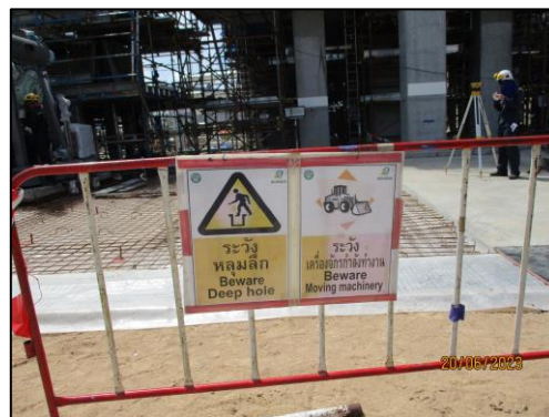
รูปที่ 2-12 ป้ายเตือนบริเวณที่อาจเกิดอันตราย