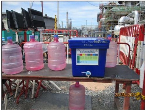
รูปที่ 2-9 น้ำดื่มสะอาด สำหรับคนงาน