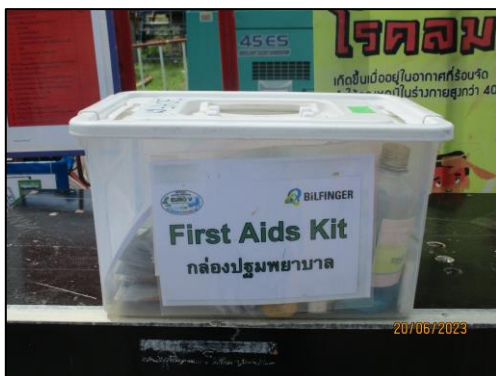
อุปกรณ์ปฐมพยาบาล เวชภัณฑ์พื้นฐาน