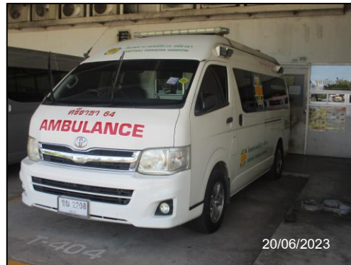
รูปที่ 2-11 รถฉุกเฉิน