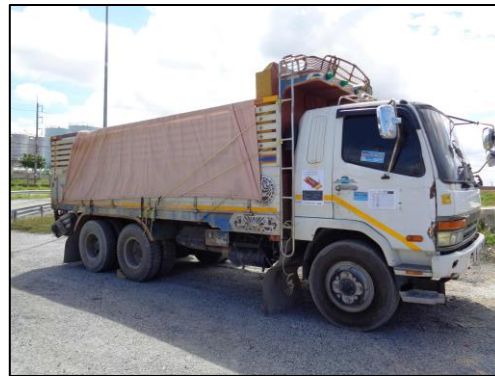
รูปที่ 2-1 การปิดคลุมส่วนบรรทุกของรถบรรทุกวัสดุก่อสร้าง