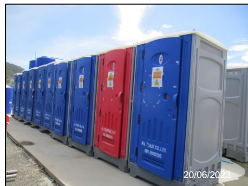
รูปที่ 2-17 ห้องน้ำ-ห้องส้วม