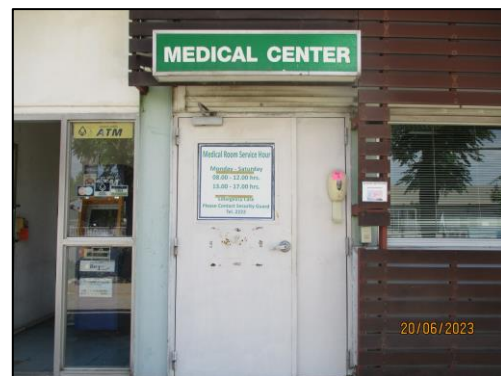
ห้องพยาบาล