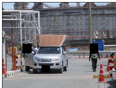
รูปที่ 2-13 เจ้าหน้าที่รักษาความปลอดภัย