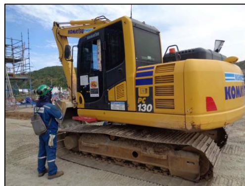
รูปที่ 2-5 กิจกรรมอบรมพนักงานขับรถ