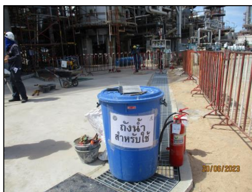
รูปที่ 2-20 ถังสำรองน้ำใช้ บริเวณพื้นที่ก่อสร้าง