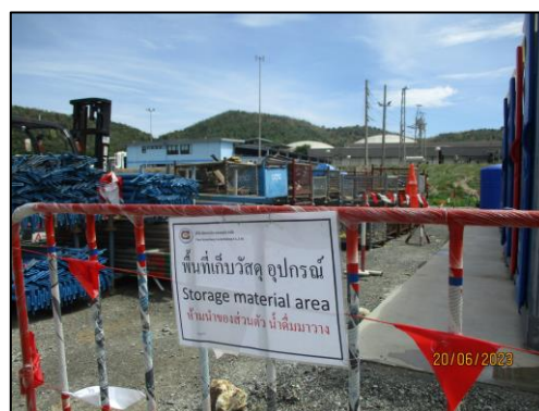
รูปที่ 2-19 พื้นที่วางอุปกรณ์ในการทำงาน